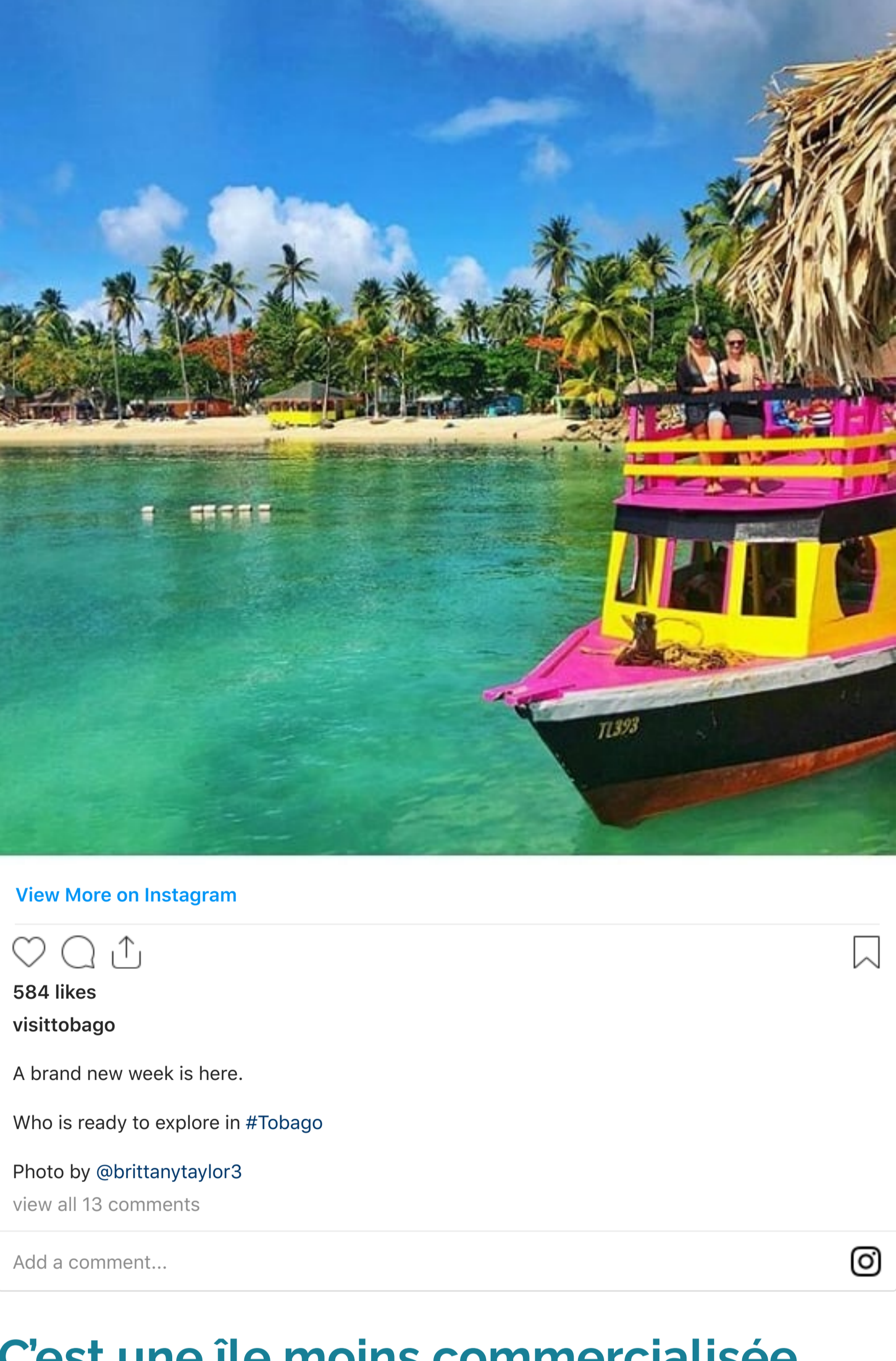
584 likes visittobago A brand new week is here. Who is ready to explore in #Tobago

Rappelons que le sceau « Safe Travels » n'est attribué qu'aux destinations avec des protocoles de santé approuvés par le WTTC. Il s'agit d'une organisation internationale dont la mission est de s'assurer que le secteur du voyage soit homogène, sûr et durable.