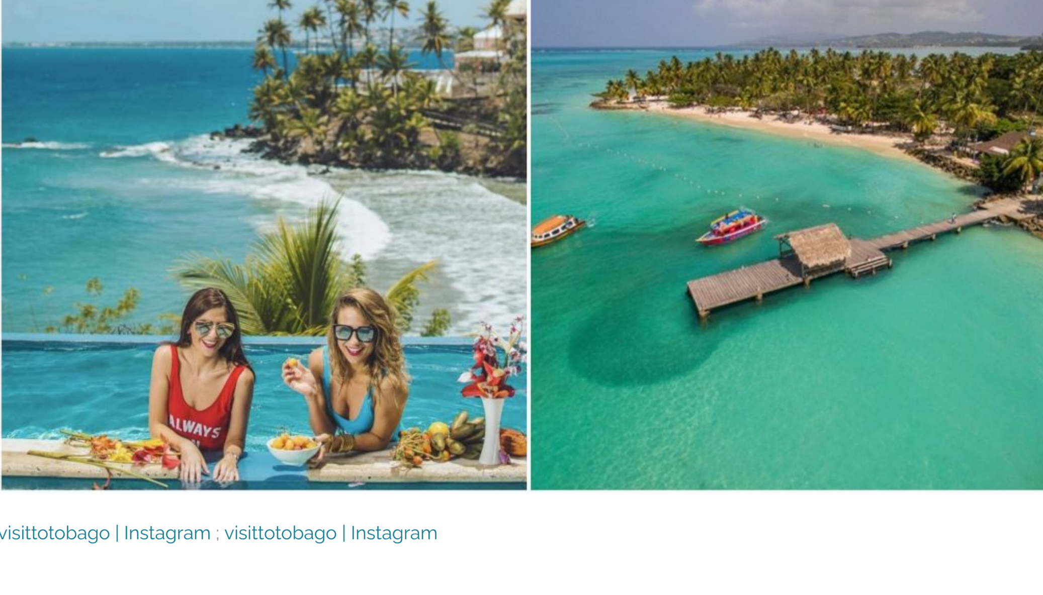
visittobago | Instagram · visittobago | Instagram

L'île de Tobago se prépare au retour du tourisme international en toute sécurité. Lorsque les Canadiens seront en mesure de voyager à nouveau, l'île caribéenne idyllique leur offrira une escapade sécuritaire loin de la foule.