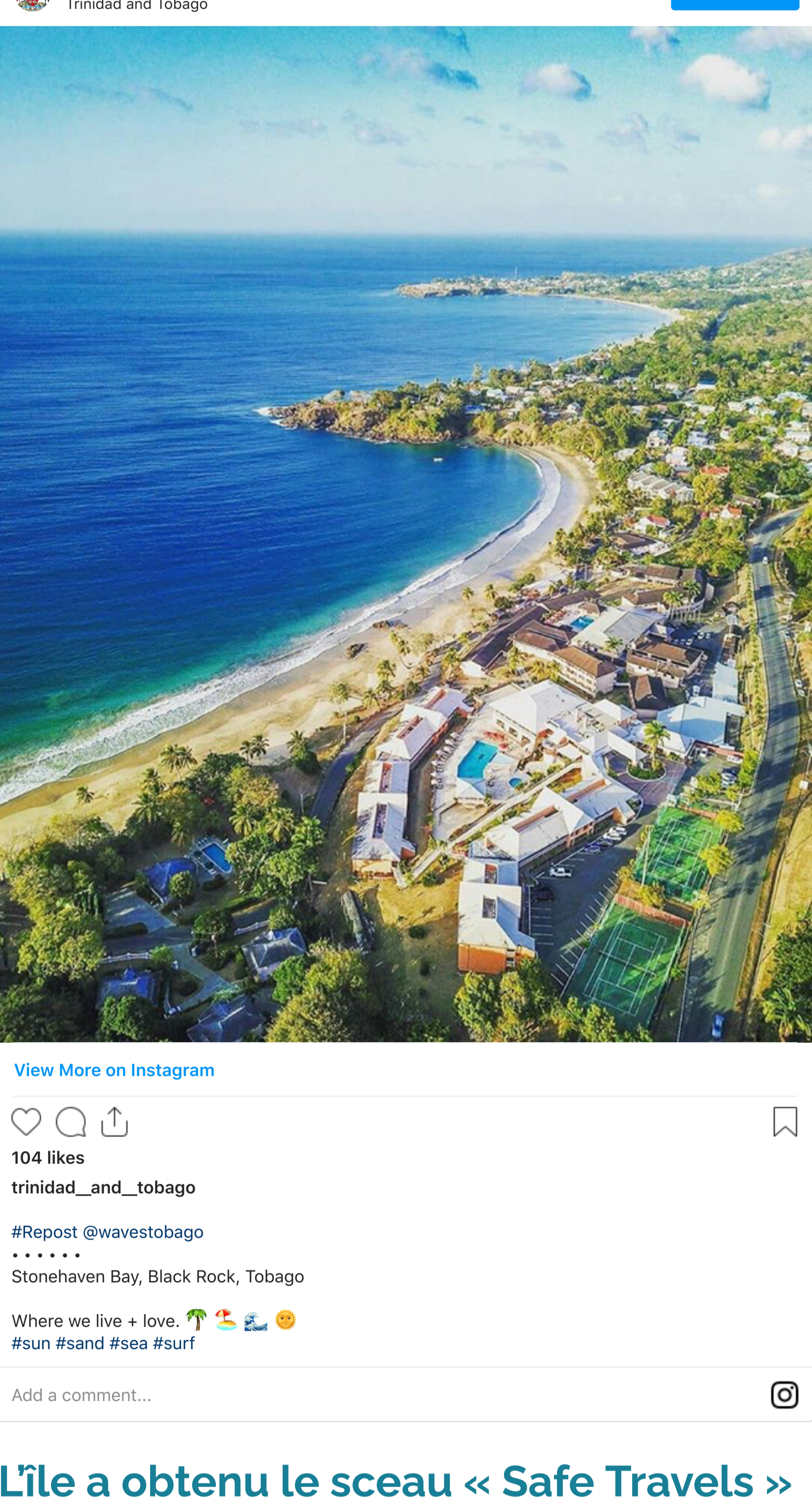
104 likes trinidad_and_tobago #Repost @wavestobago Stonehaven Bay, Black Rock, Tobago Where we live + love. #sun #sand #sea #surf

Qu'il s'agisse de faire du trekking à travers les nombreux sentiers de la réserve forestière de Main Ridge ou de profiter du soleil sur l'une des nombreuses plages, vous pouvez explorer le pays en toute sécurité, avec peu d'interaction avec les autres. Par exemple, en randonnée jusqu'à une chute d'eau, bien possible que vous ayez le site pour vous tout seul !